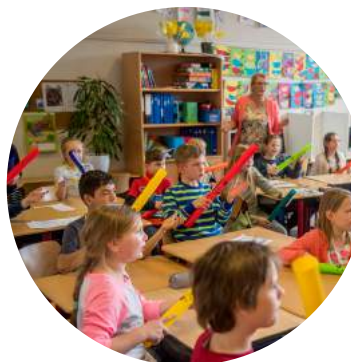
123Zing in 2017 op de Koningin Wilhelminaschool.

over de stappen die worden gezet om CBS De Arke weer op minimaal het 'voldoende-niveau' te brengen. Dit plan is al volop in uitvoering. Positief element hierbij is dat het traject met expertise uit de eigen organisatie van PCBO Leeuwarden wordt uitgevoerd.