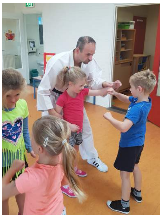
Dit jaar was er ook een atelier karate.

CBS De Finne in Aldeboarn organiseerde dit najaar traditiegetrouw de Finne-Ateliers voor leerlingen. O.a. werken met hout, kosteloos materiaal, klei, een fotocamera of tablet en lekker bewegen: de kinderen altijd actief en enthousiast betrokken. Na enkele middagen presenteren de kinderen binnen het atelier het proces en eindresultaat.